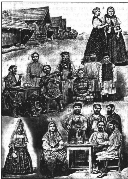
Великороссы: верховье Волги — губернии Тверская, Ярославская и Костромская

1. Улица деревни Тверской губернии. Крыши жилых домов и служб покрыты соломой, дома построены сплошной линией. У изб широкие завалинки. 2. Женщины Тверской губернии Новоржевского уезда. Головной убор и душегрея расшиты золотом. 3. Крестьяне Тверской губернии Бежецкого уезда. 4. Крестьянин Тверской губернии Весьегонского уезда. 5. Крестьянка Ярославской губернии Угличского уезда. 6. Крестьянин Ярославской губернии и уезда. 7. Крестьянин Ярославской губернии Романовского уезда. 8 и 9. Крестьяне Ярославской губернии Романовского уезда. 10. Старинный крестьянский наряд женщины Ярославской губернии. II. Женщина Костромской губернии. 12. Крестьянин Костромской губернии Галичского уезда. 13. Крестьянин Костромской губернии Кинешемского уезда. 14. Крестьянин Костромской губернии и уезда. 15 и 16. Крестьяне Костромской губернии Галичского уезда.