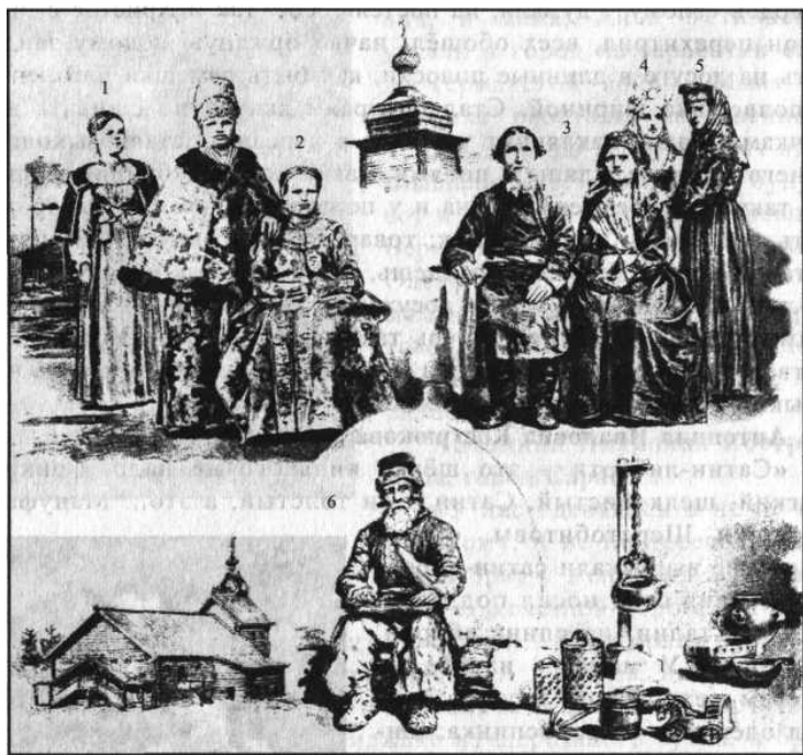
Великороссы: Северный край — Архангельская, Олонецкая и Вологодская губернии. 1. Женщины-поморки из окрестностей города Мезени, Архангельской губернии. 2. Мещанка города Архангельска. 5. Мещане города Великого Устюга, Вологодской губернии. 4 и 5. Девушка и женщина — крестьянки Сольвычегодского уезда, Вологодской губернии. 6. Крестьянин Олонецкой губернии, странствующий певец былин.

Пальто-ротонды в моде были: без рукавов накидывалось, руки внутри. Муфты. У детей - муфточки, это уж обязательно. У мальчиков - варежки. Богатые купцы - по моде одевались.