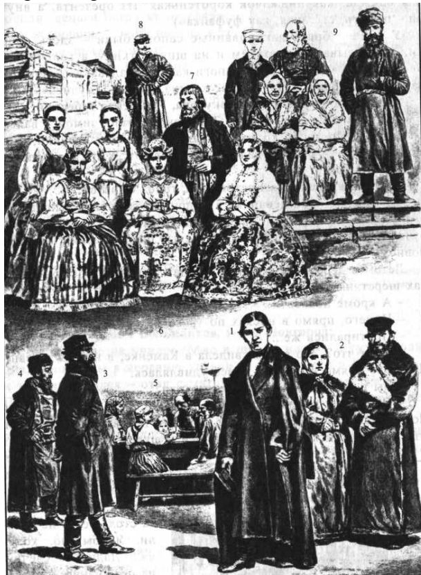
Великороссы: Санкт-Петербургская, Новгородская и Псковская губернии. 1. Биржевой артельщик из Охтян. 2. Мелкий торговец и его жена — оба из Петербургских мецан. 3 и 4. Крестьяне из окрестностей Петербурга — рыбак и ломовой извозчик. 5. Группа подгородных крестьян (Петербургской губернии) за столом, б. Женщины и девушки из Старой Руссы, Новгородская губерния. 7. Крестьянин-старовер Череповецкого уезда, Новгородская губерния. 8. Крестьянин Новгородской губернии — ямщик. 9. Крестьяне Псковской губернии

«Это сейчас приходишь в гости, разуваешься — какую-то чушь придумали. А раньше - снял калоши и идёшь, сапоги-то чистые. Раньше и плащи были: хоть целый день по дождю ходи, не промокнешь. Наверное, брезентовые были.