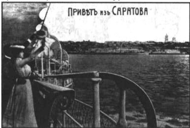
«Привет из Саратова». Открытка начала XX века

«Пуховые козы мало у кого были. Коз не держали почему-то. Шарфы — белые, пуховые — тоже тальячие. Пуховые платки у киргизов покупали, ездили в степь. С мохрами, белый платочек, небольшой, пуховый-пуховый, такой крупной вязки, а потом он слежался — не знаю что».