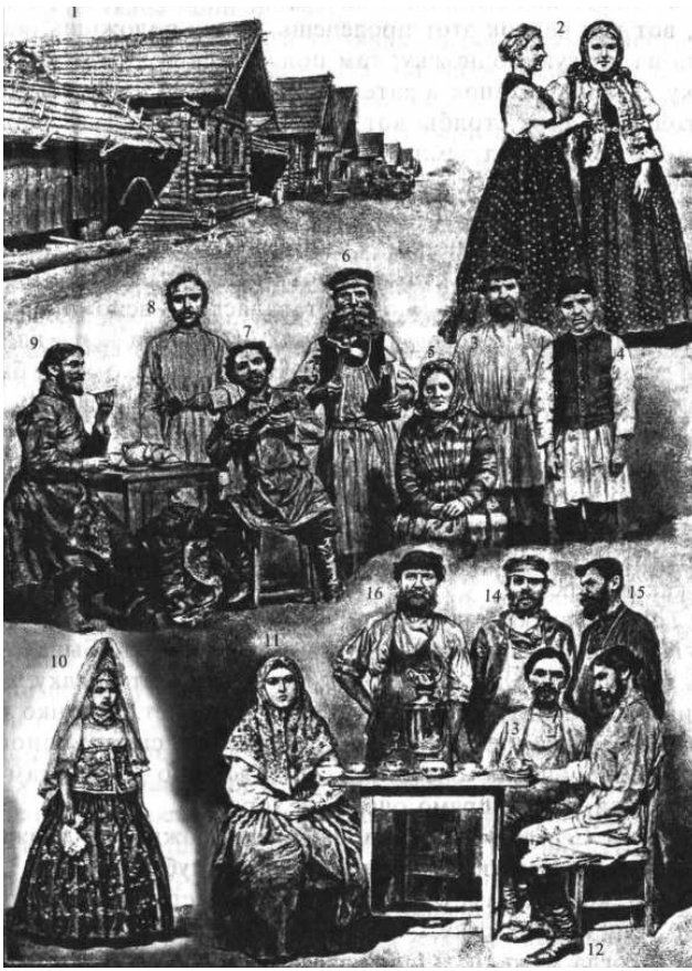
Великороссы: верховье Волги — губернии Тверская, Ярославская и Костромская

1. Улица деревни Тверской губернии. Крыши жилых домов и служб крыты соломой, дома построены сплошной линией. У изб широкие завалинки. 2. Женщины Тверской губернии Новоржевского уезда. Головной убор и душегрея расшиты золотом. 3. Крестьяне Тверской губернии Бежецкого уезда. 4. Крестьянин Тверской губернии Весьегонского уезда. 5. Крестьянка Ярославской губернии Угличского уезда. 6. Крестьянин Ярославской губернии и уезда. 7. Крестьянин Ярославской губернии Угличского уезда. 8 и 9. Крестьяне Ярославской губернии Романовского уезда. 10. Старинный крестьянский наряд женщины Ярославской губернии. 11. Женщина Костромской губернии. 12. Крестьянин Костромской губернии Галичского уезда. 13. Крестьянин Костромской губернии Кинешемского уезда. 14. Крестьянин Костромской губернии и уезда. 15 и 16. Крестьяне Костромской губернии Галичского уезда.