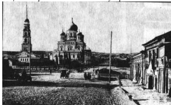
Храм Покрова Пресвятой Богородицы. Саратов. 1900-е годы