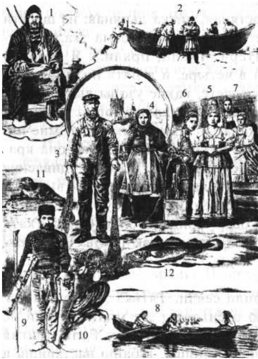
Великороссы: поморы — Северный край 1. Пустозер (промышленник из слободы Пустозерска, Архангельская губерния). 2. Поморы Мезенского уезда, отправляющиеся на промысел за морским зверем. 3. Двинский рыбак. 4. Онежская мещанка на ловле корюшки. 5. Онежская мещанка-девушка в подвенечном уборе. 6. Крестьянка из окрестностей города Архангельска. 7. Кольские поморки, — женщина (сидящая) и за нею девушка. 8. Кемлянки (женщины из Кемь) на карбасе (лодка) в открытом море. 9. Ловец речного жемчуга. 10. Перловина (Urio) — пресноводная раковина, доставляющая перламутр для мелких поделок и небольшие зёрна жемчуга. 11. Тюлень-ластик (Phoca barbata), по местному — нерпа. 12. Треска (Gadus morrhua, Morue)