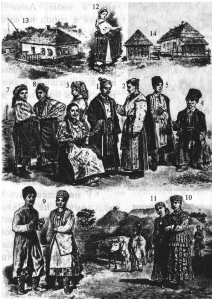
Малороссы: черноземное пространство.